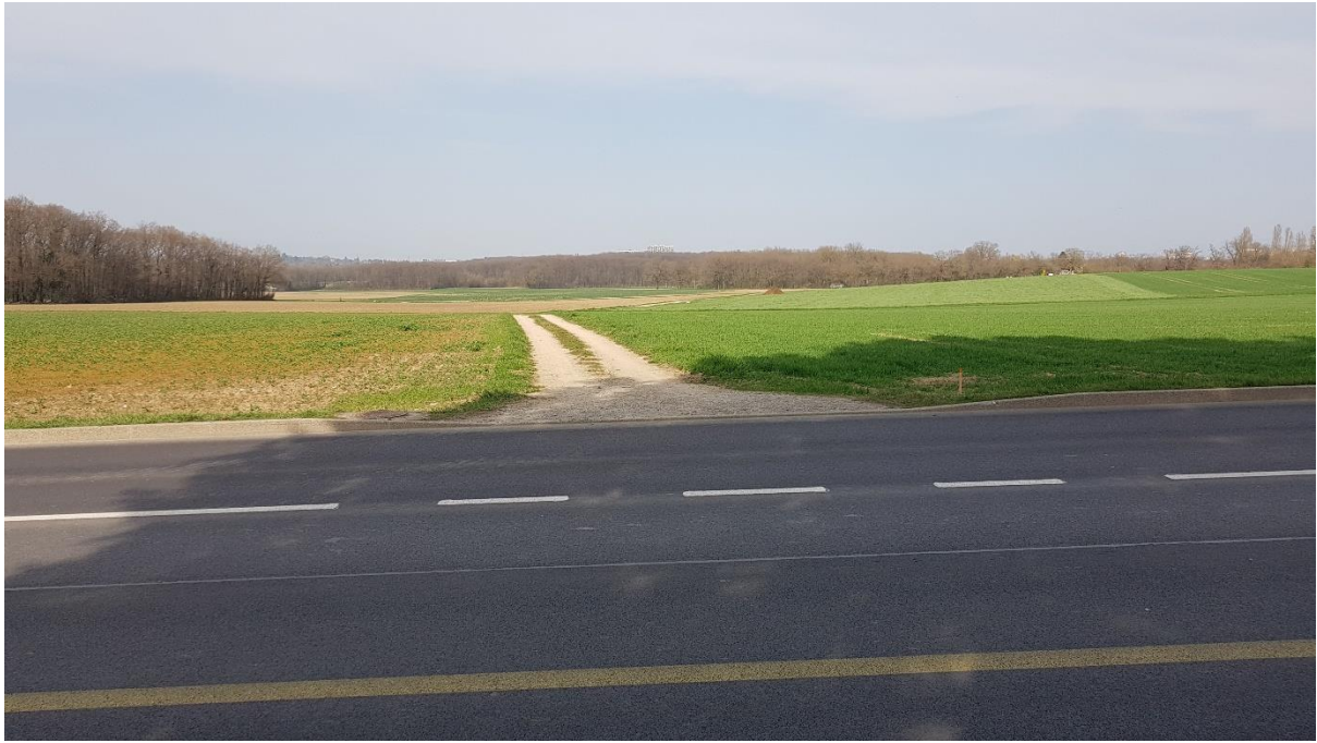
Chemin des Abarois en mars 2022, vu depuis la rte d'Aire-la-Ville