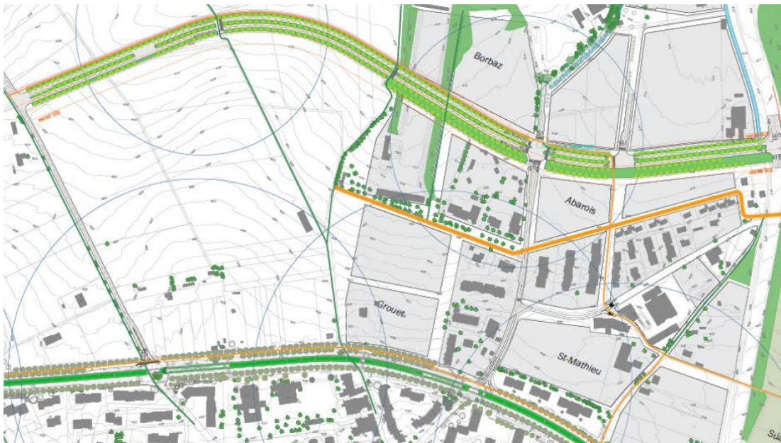
Projet tel que planifié actuellement (Bd des Abarois en haut, rte de Chancy en bas)